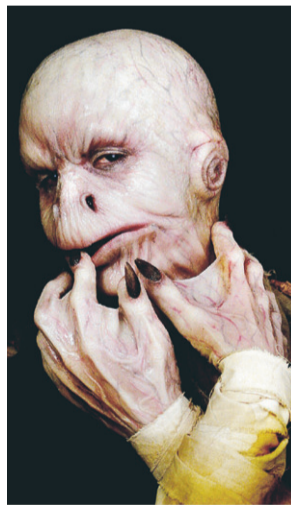
ANNORLUNDA. Skrämmande eller charmig? Som attributmakare gäller att kunna skapa alla sorters personligheter och typer.